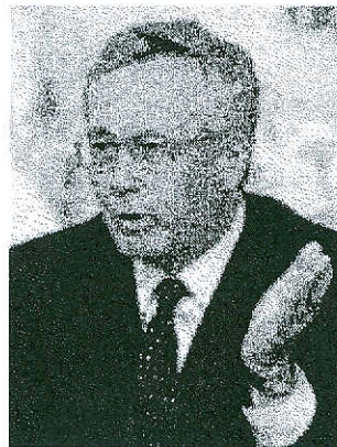
Il ministro Giulio Tremonti